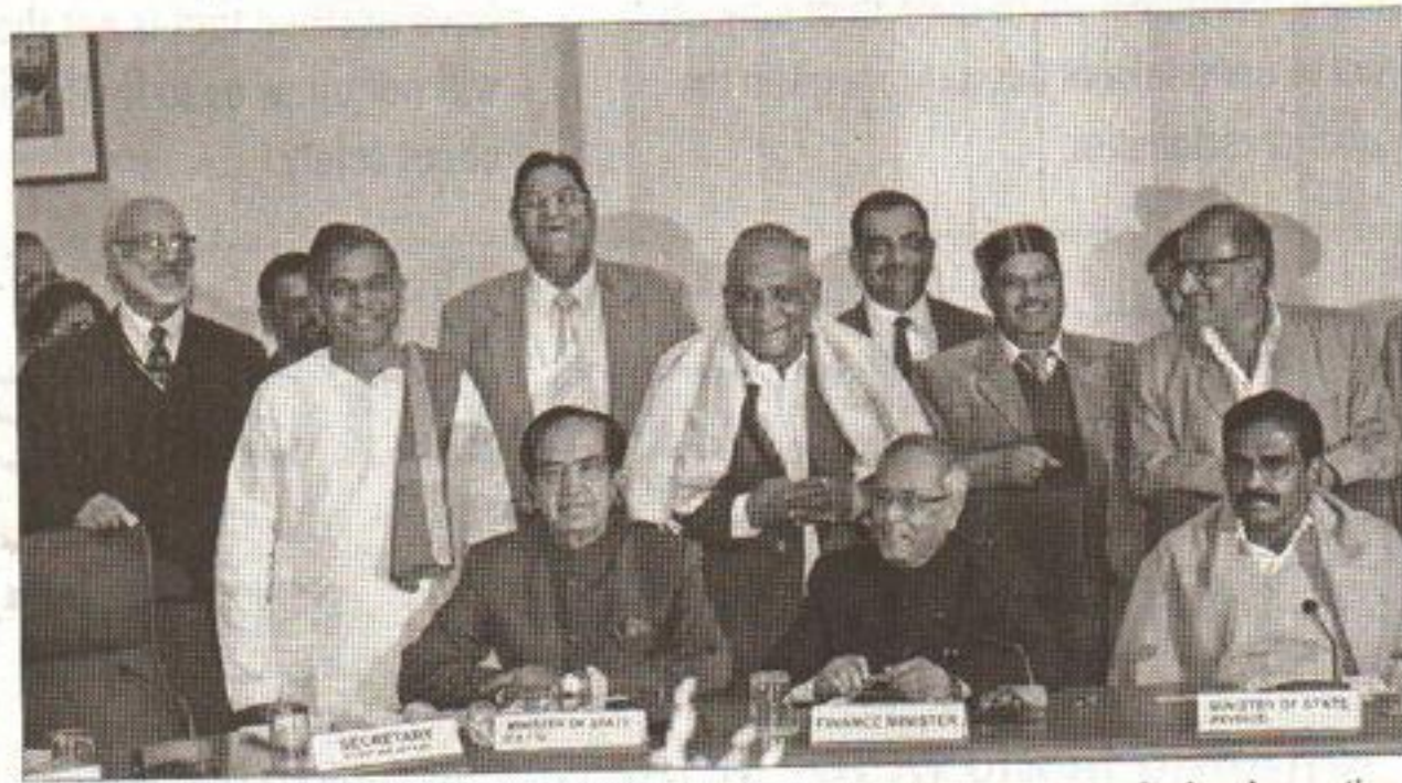
FARM TALK: Union finance minister Pranab Mukherjee kicked off budget consultations by meeting farm organisations in New Delhi on Wednesday

"Cut wasteful subsidies to push investments in agriculture, allow FDI in retail and irrigation," they told reporters adding government did not have money, which can flow into Indian farm sector only by opening up and creating conducive atmosphere private investments and FDI. Farmers in Punjab are selling potatoes at Re one a kg, much below cost of production of Rs 3-4 a kg, Gulati said this can be corrected only by long overdue reform of supply chain management. This will only ensure remunerative prices