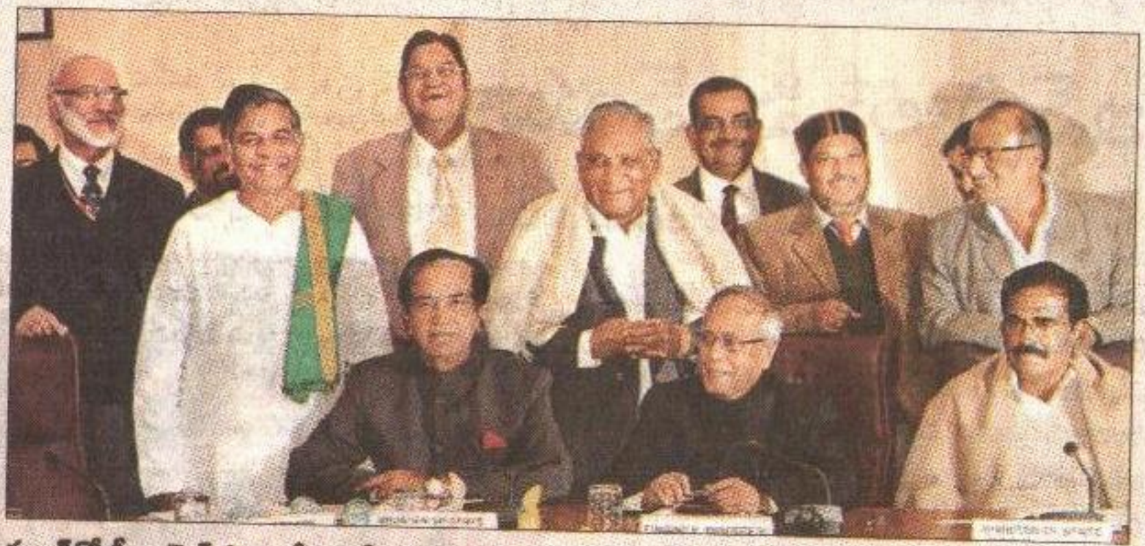
ప్రణబ్ తో ప్రీ-బడ్జెట్ సమావేశంలో పాల్గొన్న వ్యవసాయ రంగ నిపుణులు, ప్రతినిధులు